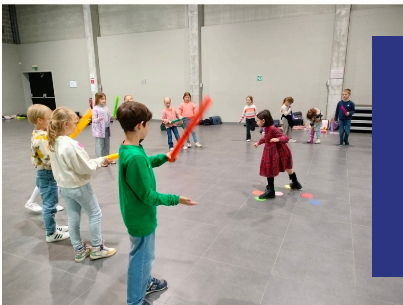
PODIUMKRIEBELS PITTEM 2024