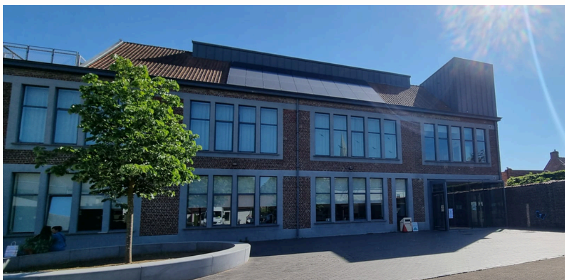
HET PORTAAL - Portaalstraat 8, 8755 Wingene